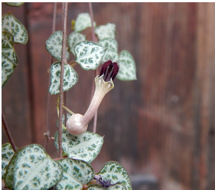
Ceratopogon - svícíník, sukulentní rostlina s komplexními květy, které vzdáleně připomínají svícný.